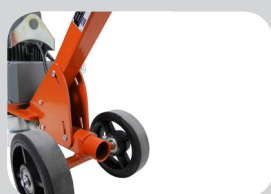
Raccord pour aspirateur