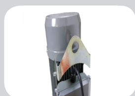
Anneau de levage